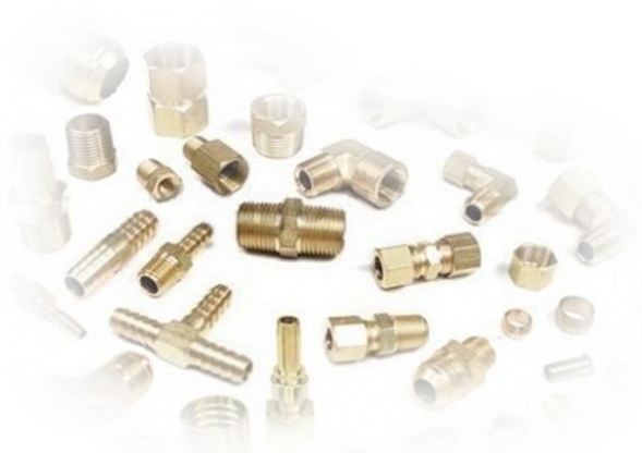
Tabela de Preços N° 9